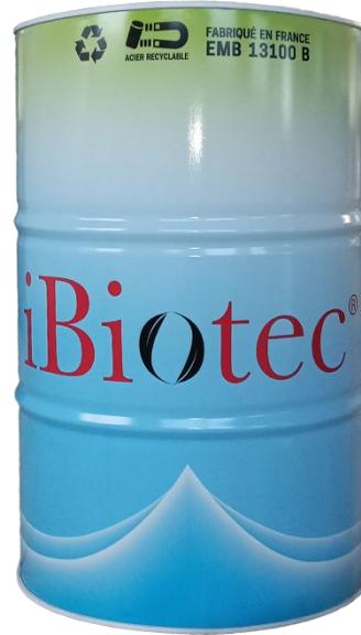
200 L 케그