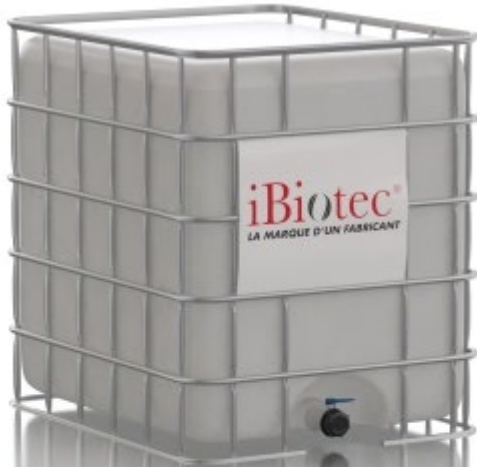
GRV 1000 L 컨테이너